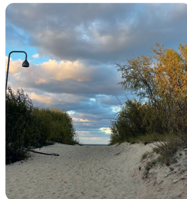
Mikoszewo, przejście na plażę