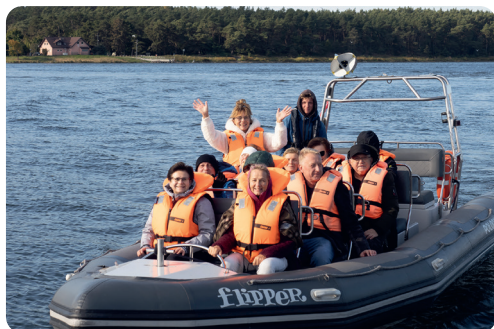
Na Zalewie Wiślanym